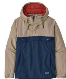
ANORAK | ISTHMUS ANORAK - SUPERIOR BLUE - HERR Patagonia 999 kr 1,599-kr